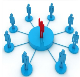
Continuïteit en overdracht