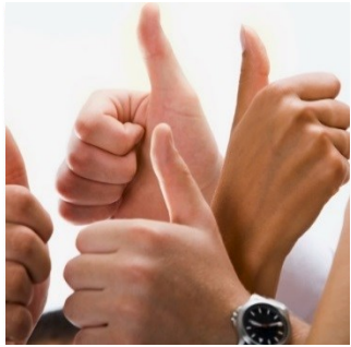
Optimale zorg en uitkomsten